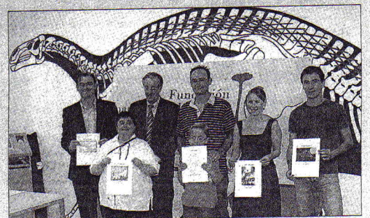
Miembros de la organización junto a los ganadores del IV certamen.